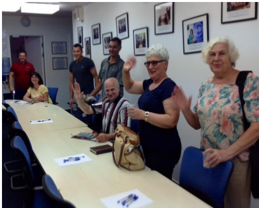
Беженцы из Украины, MOM в Киеве

В мае и июне 2014 года на Украине было проведено 16 однодневных семинаров по культурной ориентации для 292 беженцев по программе Лаутенберга.