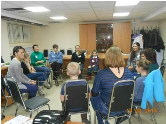
На занятиях у психолога